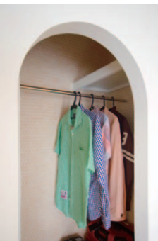
隠せるオープンクローゼット