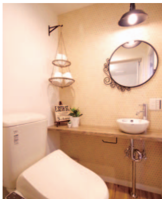
香るパウダールーム